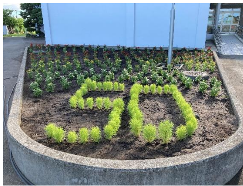
春は、パンジー、ビオラが、夏は、コキア、ジニア、サルビアが植えられました。