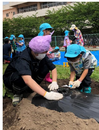
教育実習生と一緒に